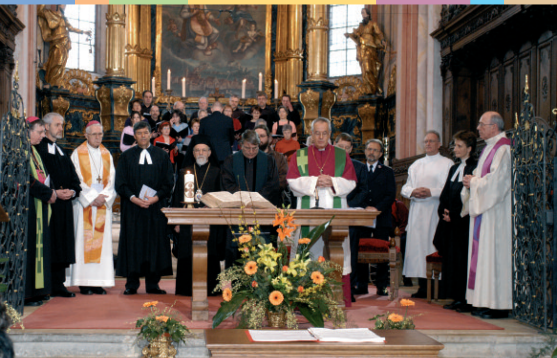
Alle Mitgliedkirchen unterzeichnen am 23. Januar 2005 in St. Ursanne die Charta Oecumenica Le 23 janvier 2005, toutes les Églises membres ont signé la Charte œcuménique à Saint-Ursanne